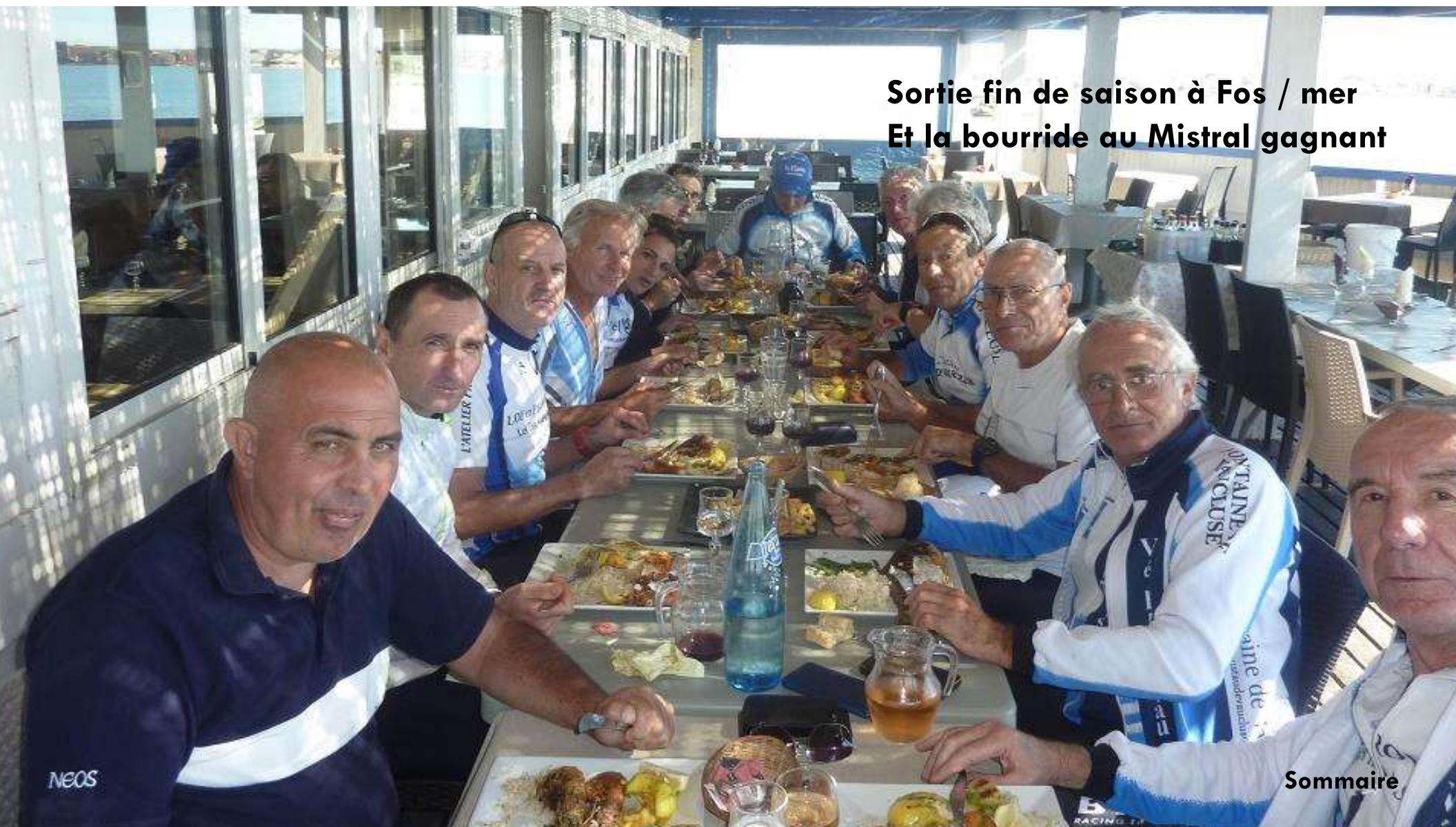
Sortie fin de saison à Fos / mer Et la bourride au Mistral gagnant