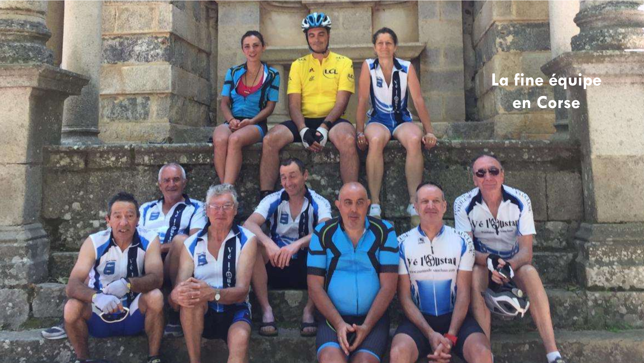
La fine équipe en Corse